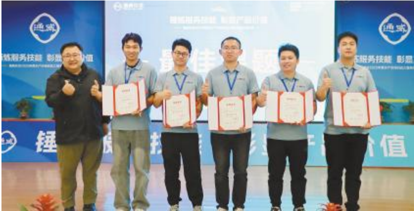
2025 年度“最佳课题奖”颁奖现场