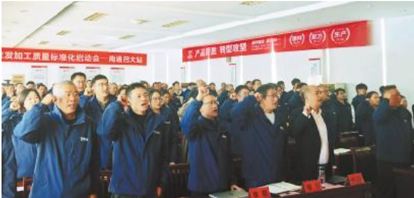
南通巴大全体干部员工庄严宣誓