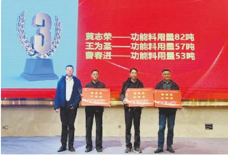
2025 年大丰通威“春季保鱼”大赛颁奖现场