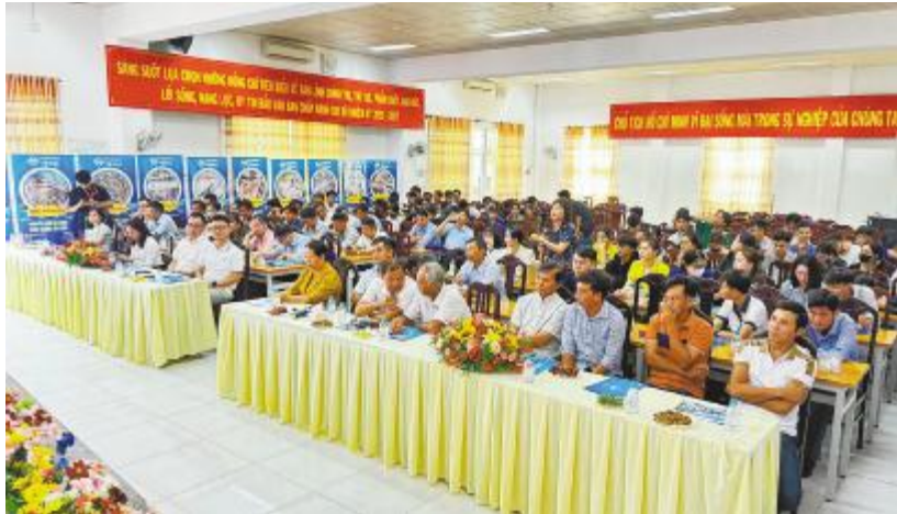
越南天邦与茶荣大学联合主办水产行业发展专业论坛

此次论坛取得了圆满成功,实现了多方共赢。对越南天邦而言,不仅有效提升了企业在高校学子中的品牌知名度与行业影响力,也为后续校园招聘及人才储备工作奠定了良好基础。同时,通过与养殖户的深度交流,进一步巩固了企业在行业内的专业形象,获得了参会养殖户的高度认可与广泛好评。此外,论坛也为校企双方后续深化产学研合作、推动资源共享搭建了重要桥梁。