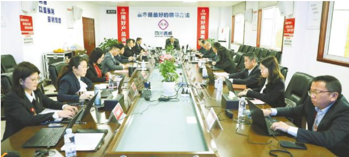
华西一区 2026 年预算启动专题会议现场