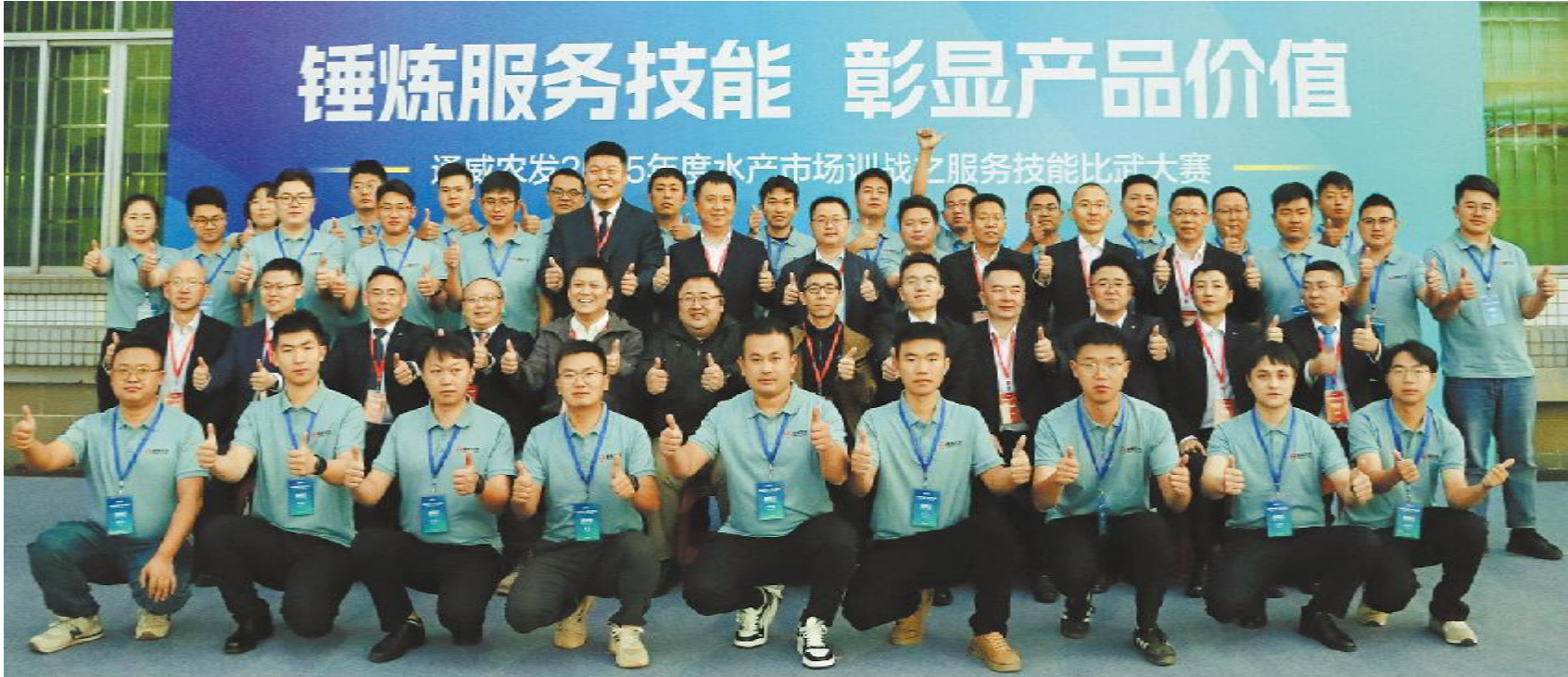
通威农发 2025 年度水产市场训战之服务技能比武大赛总决赛合影留念