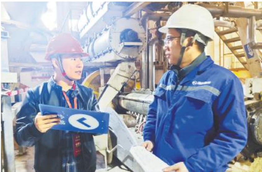
以考促学、以考促练