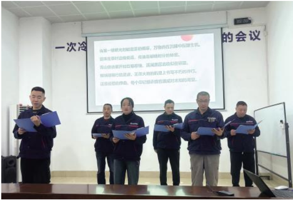
四川通威预混料比赛现场