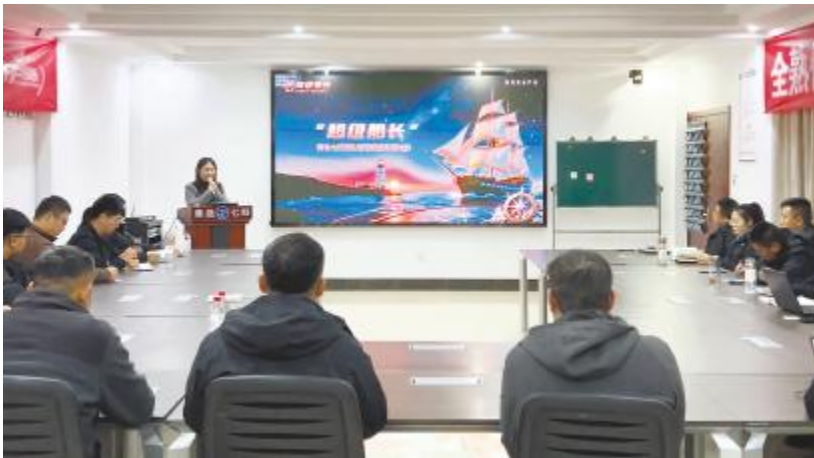
青岛七好“超级船长”团队管理赋能专项计划第三期培训现场