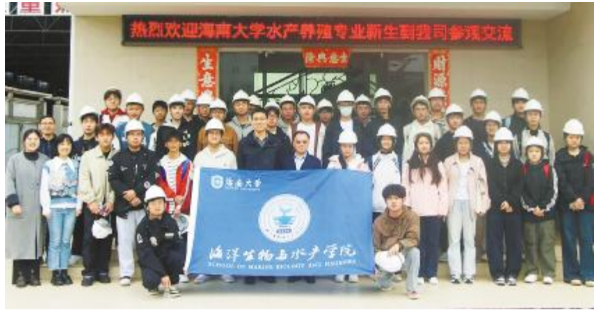
海南大学水产养殖专业师生到访南海海壹参观交流