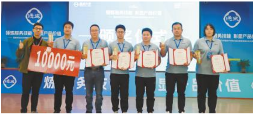
2025 年度“服务标兵”颁奖现场