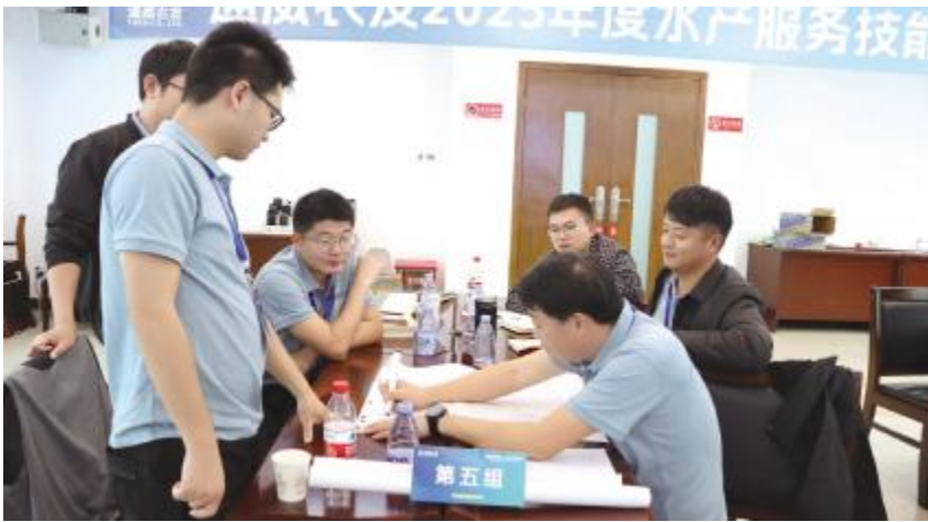
讨论中成长，合作中进步