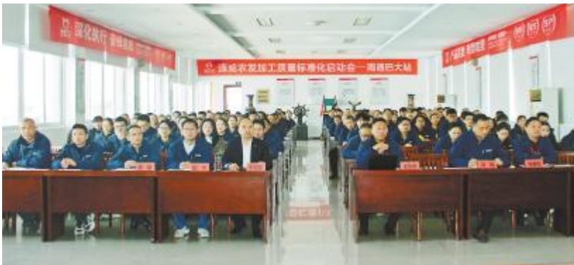
南通巴大隆重召开质量标准化启动大会