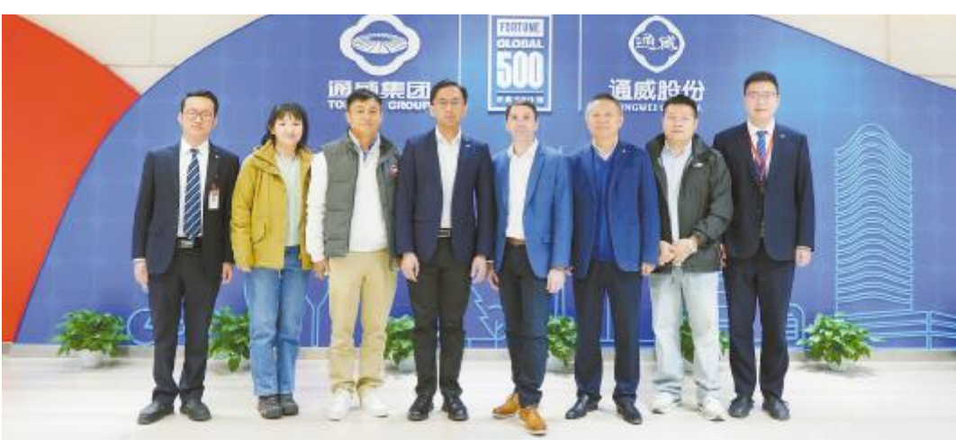
来宾一行参观集团体验中心

享技术优势与业务经验的重要平台,也为未来在水产与畜禽动物营养领域的合作开辟了新的可能性。未来,双方将充分发挥各自在技术研发与市场拓展方面的优势,携手推动行业技术升级,共同探索更广阔的合作空间,为全球动物营养健康事业注入新动力。