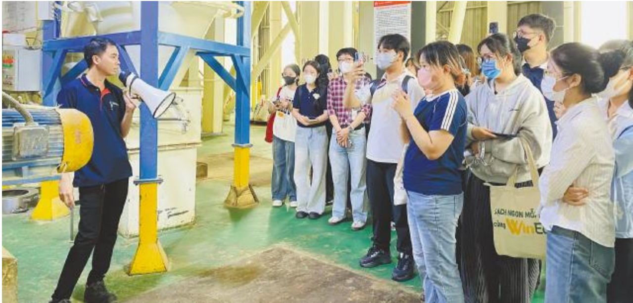
胡志明师范大学中文系大四优秀师生代表参观前江通威