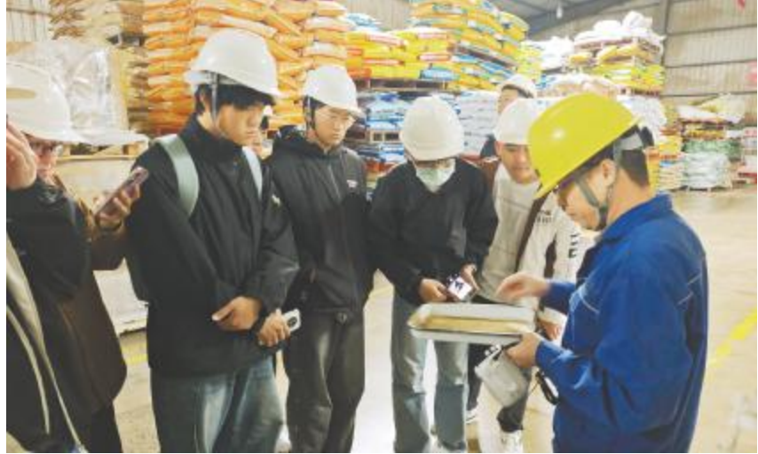
海南大学水产养殖专业师生参观了解通威“好产品”

本次活动的圆满成功,不仅帮助学生们解答了有关未来就业的疑问,也让公司看到了潜在的优秀人才,为今后的人才引进与合作奠定了良好基础。