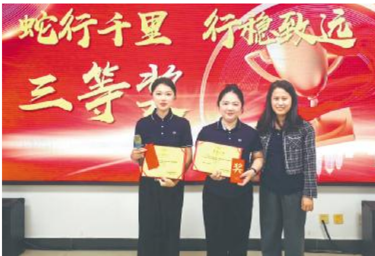
海南生物演讲比赛颁奖仪式现场