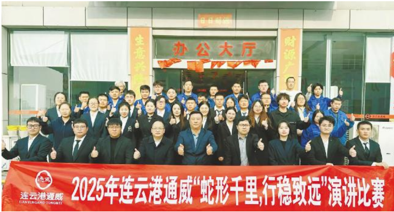
连云港通威演讲比赛合影留念