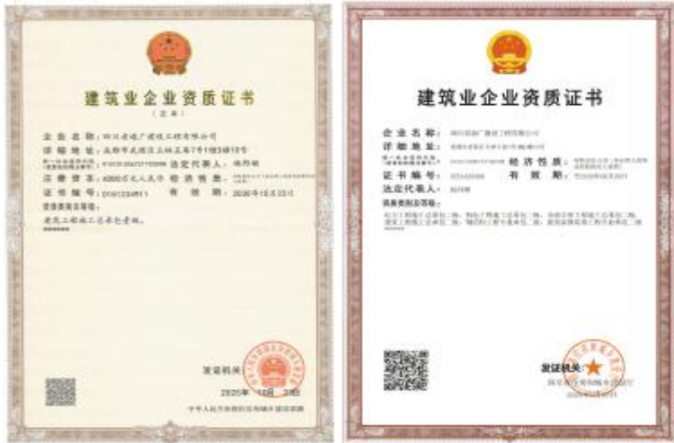
四川省通广建设工程有限公司荣获建筑工程施工总承包一级资质

站在新的发展起点,通广建设将以一级资质为契机,持续强化技术研发与项目管理能力,坚守“质量为本、诚信履约”的核心理念,积极参与通威各板块工程建设,打造更多精品工程,为通威的发展做出应有贡献。