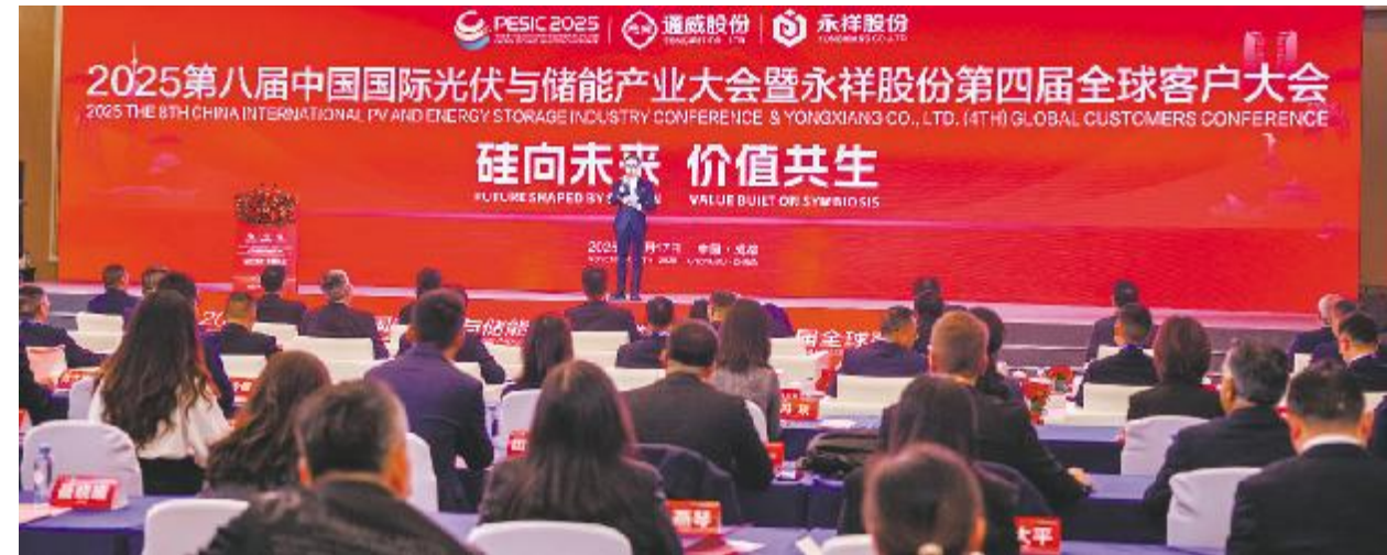
永祥股份第四届全球客户大会现场

团队出席本届大会。作为2025第八届中国国际光伏与储能产业大会的重磅环节之一,以“硅向未来 价值共生”为主题的2025第八届中国国际光伏与储能产业大会暨永祥股份第四届全球客户大会于11月17日在成都世纪城国际会议中心隆重举行。通威股份董事长、CEO刘舒琪,江苏美科太阳能科技股份有限公司董事长王禄宝,阳光能源控股有限公司