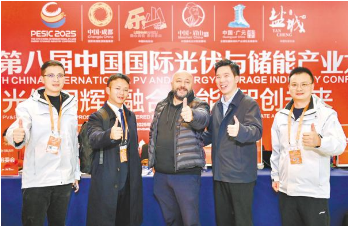
全球客户为大会及永祥股份点赞