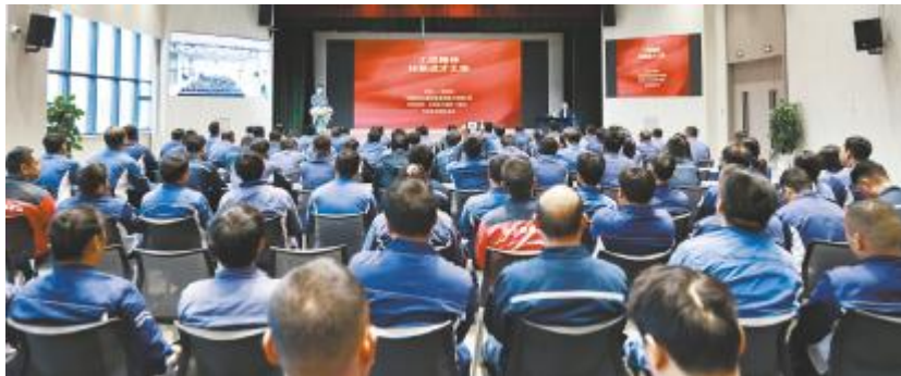
云南通威开展“工匠精神—技能成才之路”专题授课