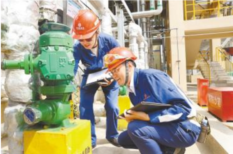
游总在项目一线开展工作

工段、班组共举办百十来场“降本增效+融合创新”沙龙讨论活动,覆盖全员,用真实案例算“细账”,现场员工可直接对标复制。常态化阿米巴培训,聚焦“识别消除八大浪费”与“全员阿米巴”两项重点举措,平均每月,消除浪费点 600 项,提报合理化建议 4500 条,形成“培训—提案—奖励”形成闭环。