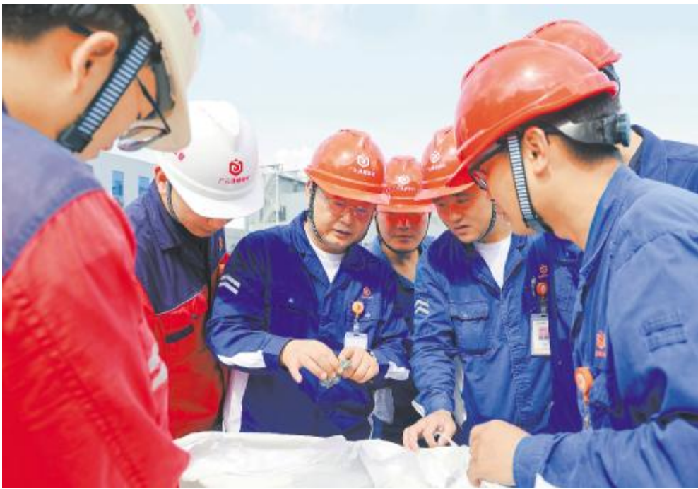
陈总与一线员工交流沟通

总结而言,公司不将外部环境变化视为制约,而是视作倒逼管理升级、激发创新活力的契机。通过夯实运营基础,强化技术驱动、优化资源配置和凝聚全员智慧,公司不断提升自身的成本控制力和市场适应力,确保在复杂多变的环境中持续实现降本增效目标,稳步迈向高质量发展。