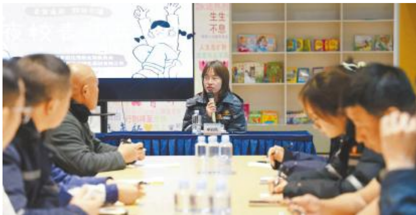
通威绿材(内蒙古)“青骑兵”夜校现场