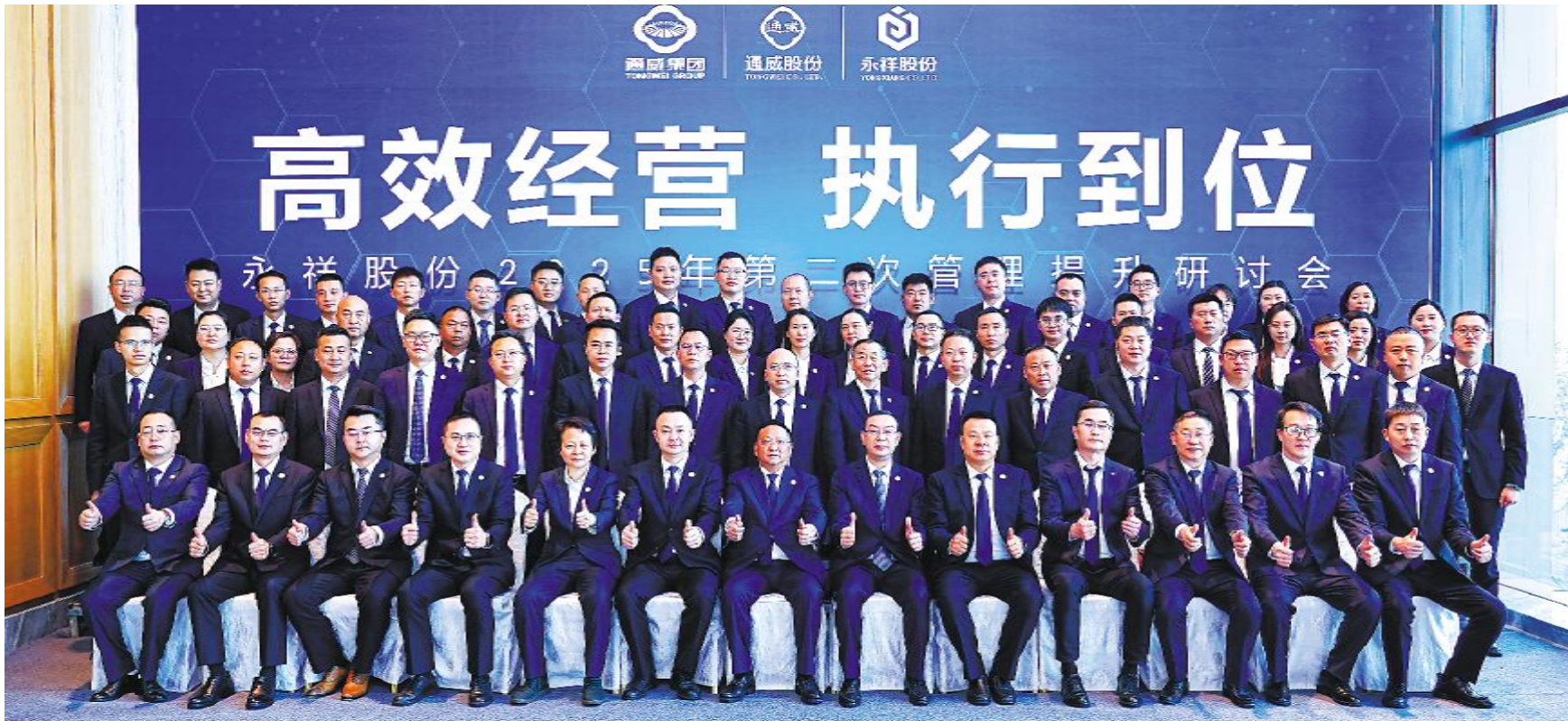
永祥股份成功召开 2025 年第二次管理提升研讨会