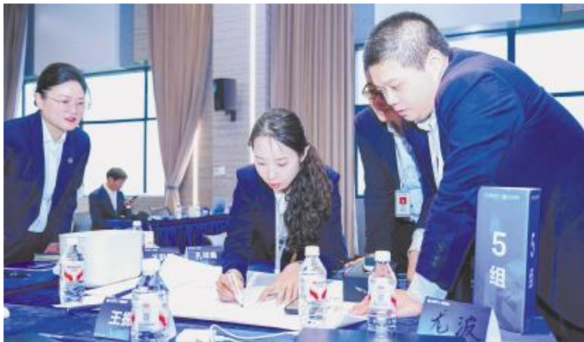
“职航计划”课程开发现场

11 月 17 日,通威绿材(内蒙古)“青骑兵”夜校正式开课。本次活动由公司工会与共青团达茂联合委员会联合策划推出,旨在丰富员工业余文化生活,提升综合素质,助力青年成长成才。第一期青年夜校聚焦青年实际需求与兴趣,精心设置了书法、健身两门课程,帮助青年员工感受传统文化魅力,陶冶情操,提升文化修养与专注力;同时,助力员工增强体质,释放工作压力,培养积极健康的生活习惯。两门课程的开设,力求从精神文化与身体健康两个维度,为青年员工的全面发展注入新动能。此次活动精准聚焦文化传承与健康生活,是公司关心关爱青年、加强企业文化建设的重要举措。希望全体学员,珍惜学习机会,在学习中收获知识与技能,享受过程与乐趣,不断赋能自我,实现个人与公司的共同成长。