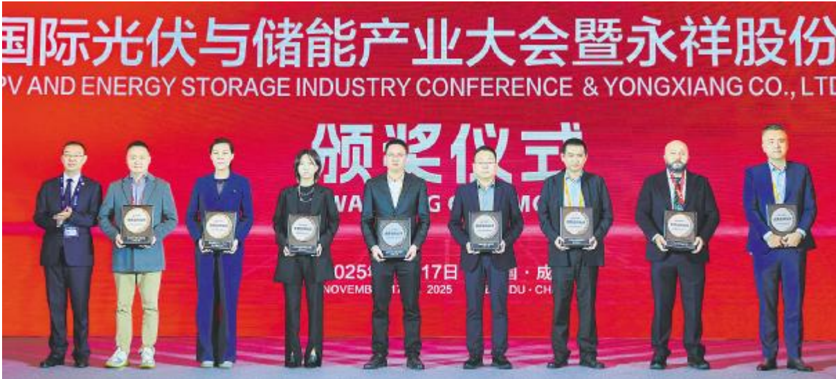
2025 年度优秀合作伙伴颁奖仪式现场