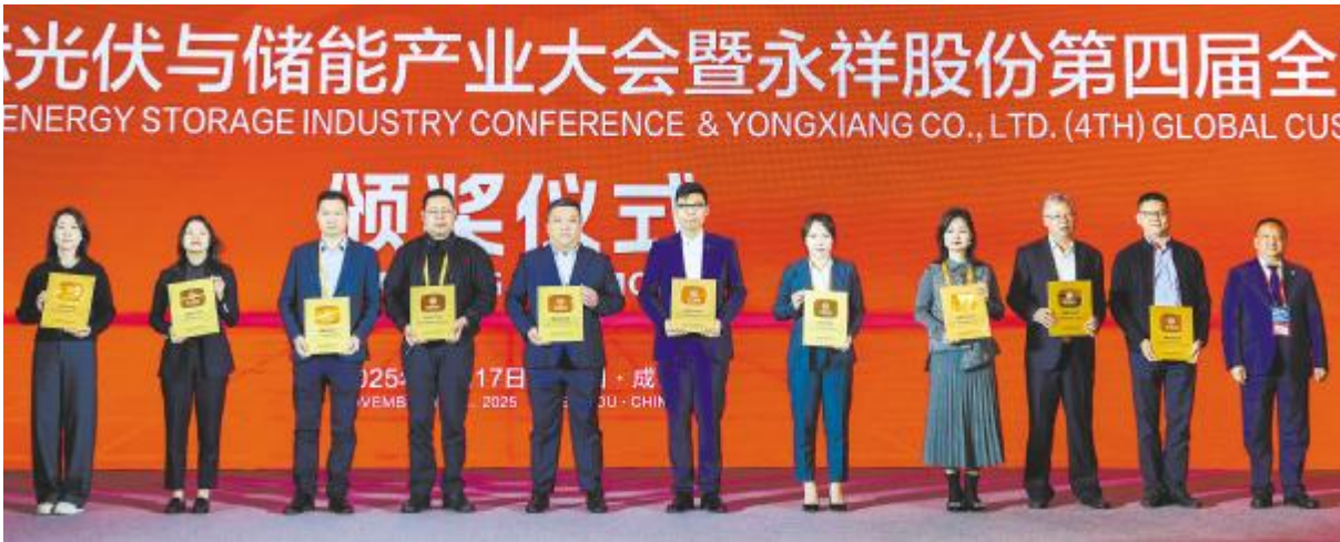
2025 年度战略合作伙伴颁奖仪式现场