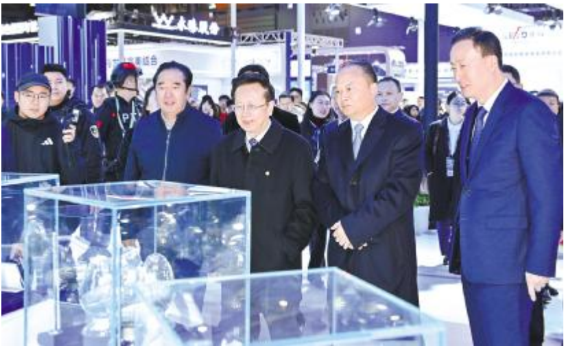
十一届、十二届全国人大常委会副委员长陈昌智等领导嘉宾参观永祥股份展台

本报讯(记者 冯书遐)作为中国乃至全球前三的光储国际盛会之一,11月17-20日,2025第八届中国国际光伏与储能产业大会在成都世纪城新国际会展中心隆重举行。十一届、十二届全国人大常委会副委员长陈昌智出席大会并宣布开幕。重要领导、全球光伏行业权威专家学者、领军企业家、光储企业代表齐聚一堂,汇智聚力,持续助力世界绿色可持续发展。通威股份副总裁、永祥股份总经理李斌携高管